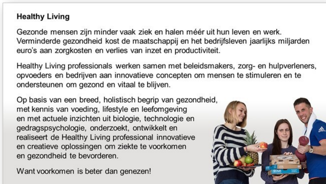
Figuur 2.2: De nieuwe opleiding Healthy Living die in Venlo is gestart.

In 2019 is op de locatie Venlo de ontwikkeling van de nieuwe opleiding Healthy living ter hand genomen. De opleiding is gekoppeld aan de ontwikkelagenda van de regio en wordt in nauwe afstemming met Fontys Hogeschool ontwikkeld. Vooruitlopend op de start van de nieuwe opleiding is binnen de opleiding Food-Innovation een afstudeerprogramma Healthy Living ontwikkeld.